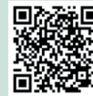
Stand: April 2026

🌐 www.ib-suedwest.de 📘 www.facebook.com/ib.suedwest 📷 www.instagram.com/ib.suedwest