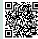
Stand: Februar 2025

www.ib-suedwest.de www.facebook.com/ib.suedwest www.instagram.com/ib.suedwest