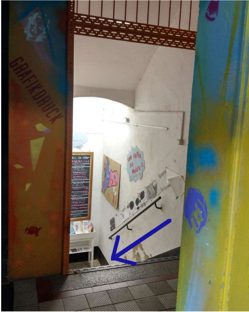
Treppe runter und dem Weg folgen