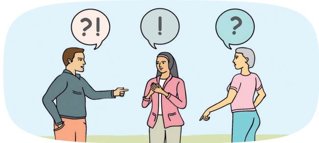
Workshops für Menschen ab 16 Jahren

Wir wollen mit sehr unterschiedlichen Menschen über ihre eigenen Werte und Interessen und über Demokratie und Menschenrechte ins Gespräch kommen. Dafür nutzen wir: