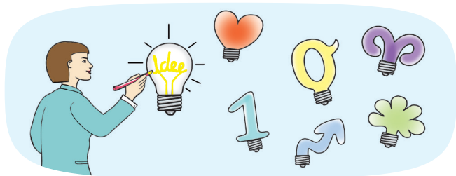
Spannende Formate und Methoden