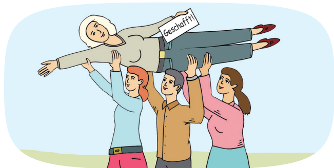
Fortbildungen für Fachkräfte in der Bildungs- und Sozialarbeit