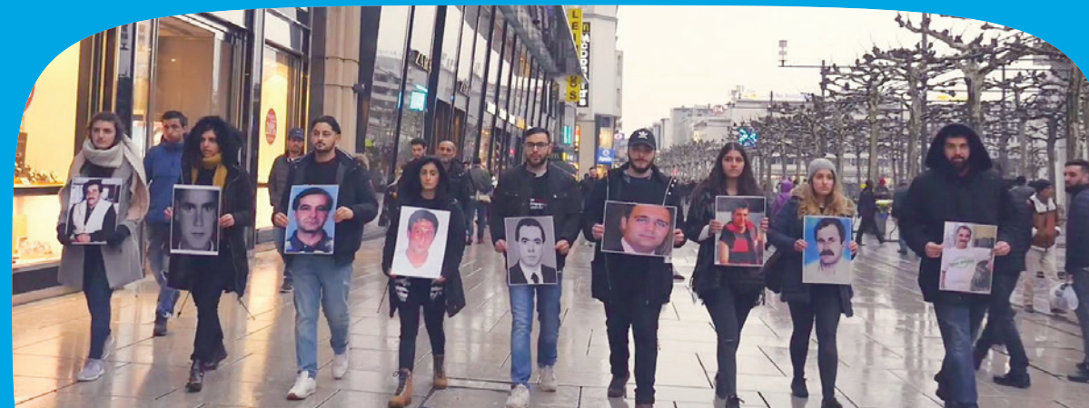
Bild aus dem Kurzfilm: „Aufstehen gegen den Hass – NSU – Kein Vergessen. Aufklären. Entgegentreten.“

Die Wanderausstellung und das Projekt wurden vom Jugendaktionsprogramm „Partizipation“ (2017-2019) des Hessischen Ministeriums für Soziales und Integration und der Jugendbildung Hessen der IB Südwest gGmbH finanziert. Für die Umsetzung ist die Jugendbildung Hessen verantwortlich.