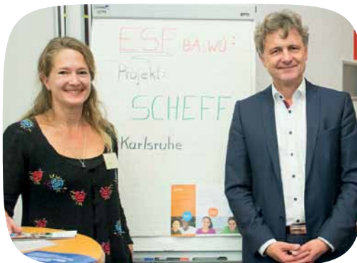
© Europabüro der baden-württembergischen Kommunen | DStGB

www.internationaler-bund.de/angebot/10036/