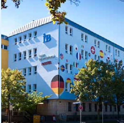
Hostel haus international